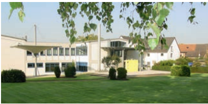
Konzernzentrale in idyllischer Lage in Ober-Ramstadt in der Nähe von Frankfurt

Sehr geehrter Kunde, sehr geehrter Geschäftspartner,